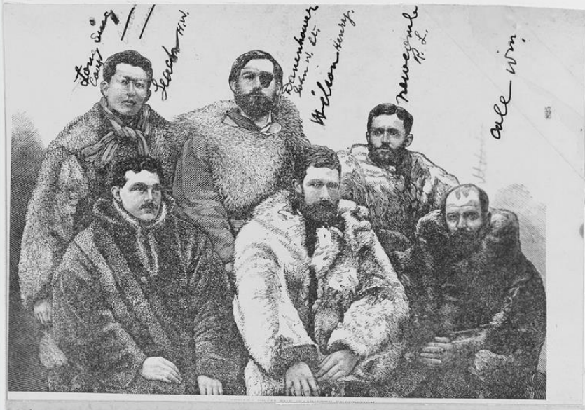
Экспедиция Д. Де-Лонга на судне "Жанетта". Судно было уничтожено льдами.

Предположение о существовании открытой воды в замерзающих арктических морях возникло в XVI веке. Данная гипотеза сыграла большую роль на первых этапах исследований Арктики и способствовала снаряжению различных экспедиций. Чья экспедиция проверила данную теорию и почему?